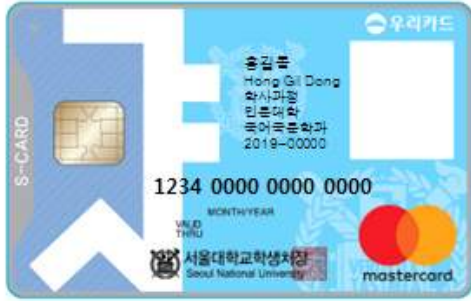
< 앞 면 >