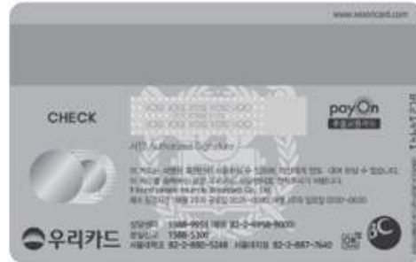
< 뒷 면 >